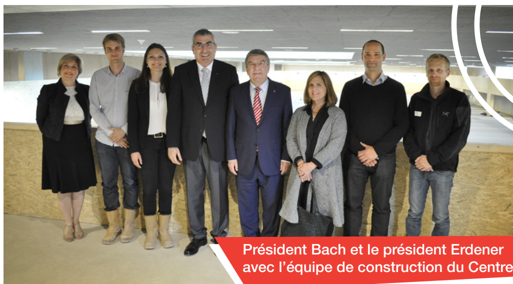
Président Bach et le président Erdener avec l'équipe de construction du Centre

Avec un bâtiment entièrement isolé et étanche, ainsi que les portes, les fenêtres, les plafonds et les sols des bureaux installés, le président du CIO a pu se faire une idée de l'aspect qu'aura le bâtiment lorsqu'il sera opérationnel cet été. Parmi les dernières tâches à accomplir, il reste la pose du revêtement de sol de sport dans la salle