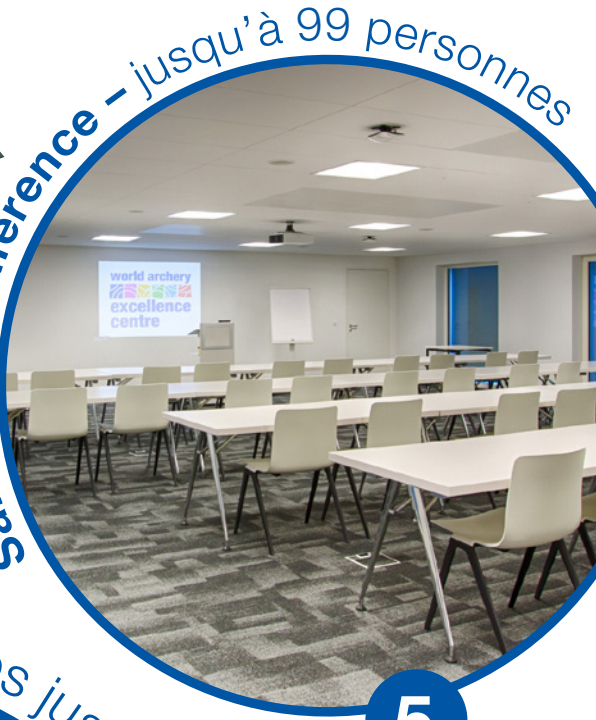
Salles de conférence – jusqu'à 99 personnes