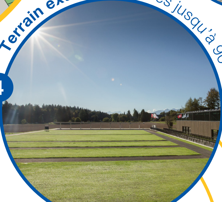
Terrain extérieur – cibles jusqu'à 90 mètres