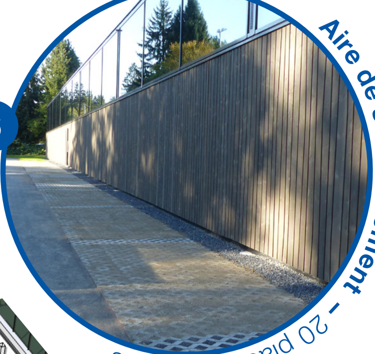
Aire de stationnement – 20 places gratuites