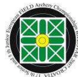
Européens Field 2007