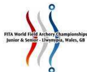
Mondiaux Field 2008