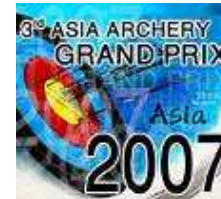
Grand Prix AAF 2007