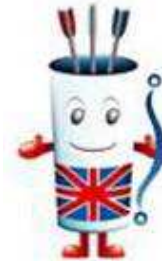
Championnat du Monde en Campagne 1-6 septembre 2008