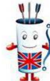
Championnat du Monde en Campagne 1-6 septembre 2008