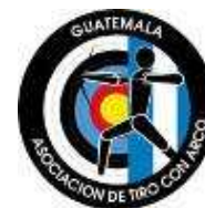
Tournoi de Classement Mondial 30 avril-7 mai 2008