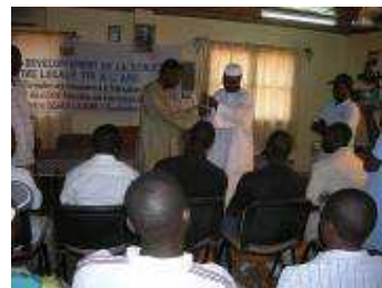
Cérémonie de clôture

La seconde partie du projet est en cours de réalisation et consiste à former des entraîneurs en leur apportant des connaissances en technique d'entraînement, et en leur apprenant les règles de compétition de base. La formation se terminera le 11 avril 2008.