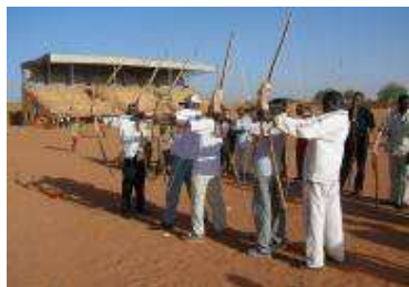
Les menuisiers et leurs arcs

Au cours de la cérémonie de clôture, le Secrétaire Général du Comité Olympique s'est montré surpris par le travail accompli par les menuisiers en si peu de temps et a profité de l'occasion pour offrir deux arcs et des flèches au Ministre.