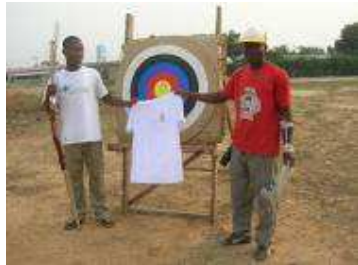
Prix pour le meilleur archer

De retour du Championnat d'Afrique au Caire, les archers n'ont pas pu reprendre l'entraînement avec les arcs de compétition parce qu'ils sont en réparation. Ils ont donc utilisé les arcs d'entraînement pour préparer les phases nationales. A cette occasion, les flèches modernes seront utilisées dans la compétition par équipe où chaque département mettra en compétition ses meilleurs archers tant les hommes que les dames.