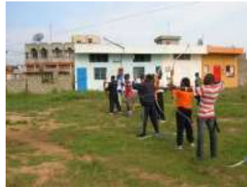
Utilisation du moderne