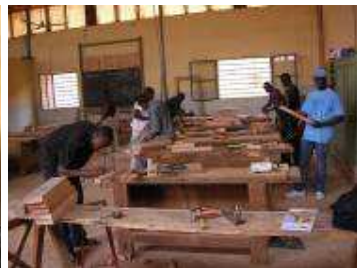
Atelier de fabrication