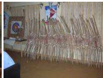
Exposition des arcs fabriqués

Au cours de la cérémonie de clôture, le Secrétaire Général du Comité Olympique s'est montré surpris par le travail accompli par les menuisiers en si peu de temps et a profité de l'occasion pour offrir deux arcs et des flèches au Ministre.