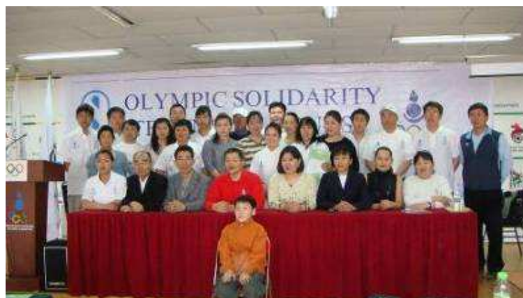
Cérémonie de clôture

Un stage technique s'est tenu à Ulaanbaatar du 5 au 15 avril 2008 sous la direction de l'entraîneur Kim Hyung-Tak, membre du Comité des Entraîneurs de la FITA. Le cours a rassemblé 31 entraîneurs provenant de toutes les régions du pays.