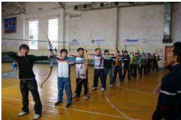
Session d'entraînement pour les jeunes archers