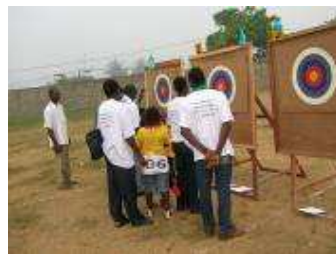
Terrain de compétition