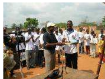
Récompense au Président de la Ligue