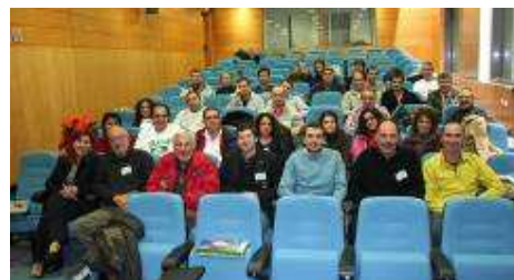
Les participants dans l'Auditorium de l'Hôtel de Ville

La Municipalité a mis à disposition gratuitement le magnifique nouvel Auditorium de l'Hôtel de Ville PATEO DO VALVERDE ainsi que son personnel et les installations pour le séminaire. Elle a également sponsorisé les pauses-café, servies dans le hall à l'extérieur de l'Auditorium.