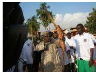
Ministre des Sports de la Guinée