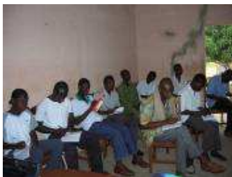
Séminaire des juges

Ces championnats ont connu une grande couverture médiatique au niveau national grâce au dynamisme du président de la Ligue de Lokossa récompensé pour la réussite de cet événement.