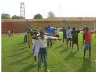
Simulation avec bande élastique