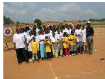
Les Juniors et Cadets ensemble