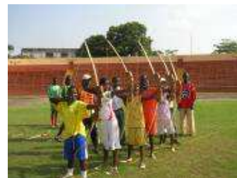
Débutants sur le pas de tir