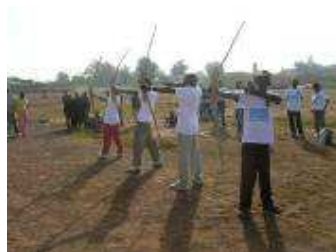
Ligne de tir