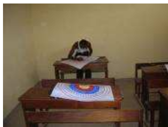
Fabrication de blasons