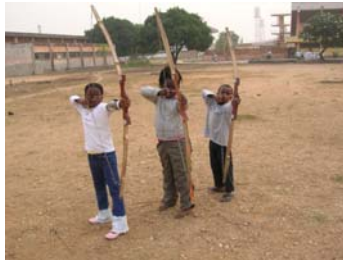
Les plus petits sur le pas de tir