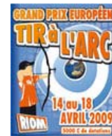
Grand Prix EMAU (1e étape) 14-18 avril 2009