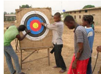
Les archers au décompte des points

Au niveau international, le Bénin s'apprête à accueillir en août 2009 une compétition avec des arcs en bambou, des arcs d'entraînement et des arcs de compétition. Afin que cet événement soit un succès, la FITA a déjà envoyé du matériel moderne aux pays ciblés. Cette compétition sera suivie d'un séminaire international pour les entraîneurs de niveau 1.