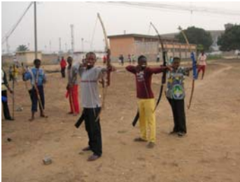
Les archers sur le pas de tir

Le 25 janvier 2009, une compétition a rassemblé les archers de Cotonou. Les distances de tir étaient de 20 et 15 mètres pour les adultes et de 5 mètres pour les plus jeunes.