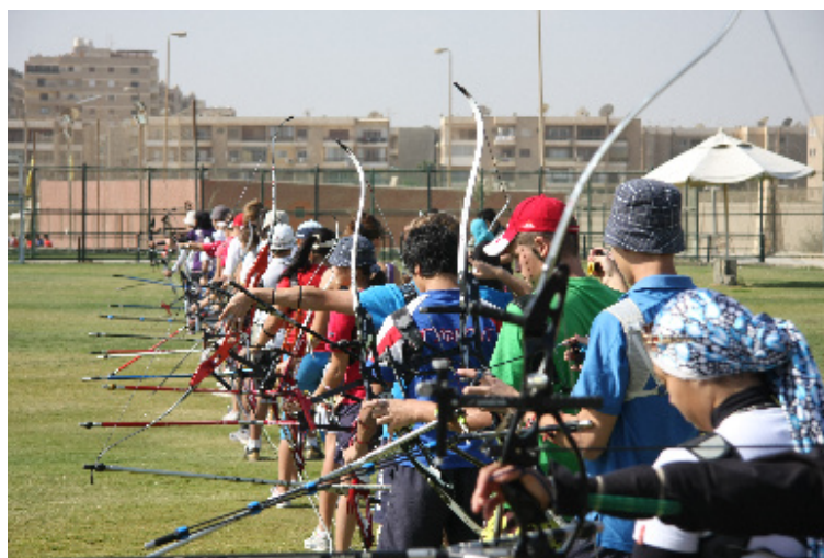
Equipe Nationale Egyptienne à l'entraînement avec l'Equipe Russe Junior.