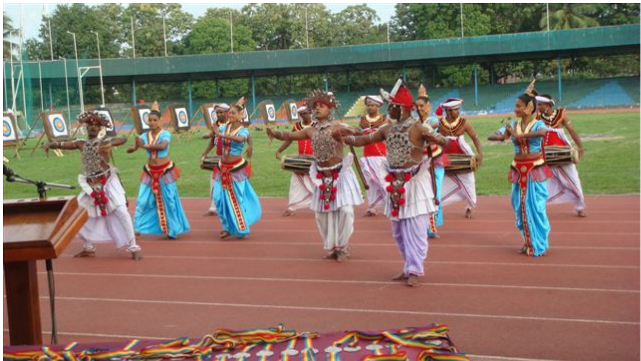
Cérémonie de clôture