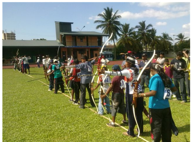
Pendant la compétition