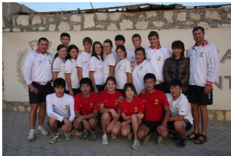
Equipe Nationale Russe Junior