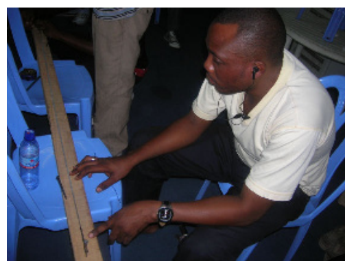
Fabrication de cordes