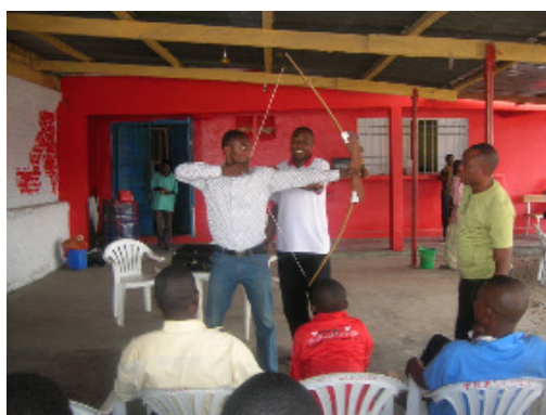
Simulations avec l'arc