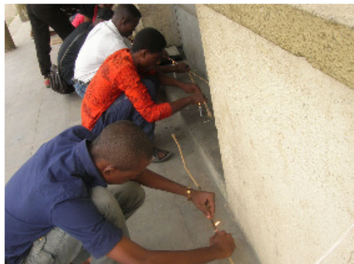
Redressement de flèches