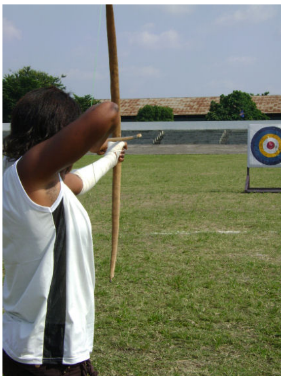
Championnat National 2010