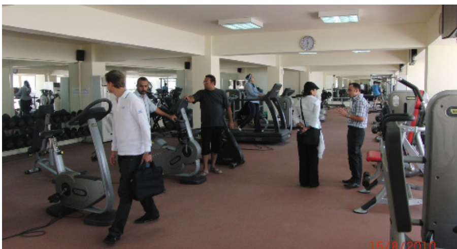
Visite de la salle de fitness et questions aux employés

La SO est un important partenaire du développement mondial du tir à l'arc. Le nouvel accord entre la SO et le MEAC de la FITA est un superbe atout supplémentaire.