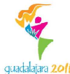
Jeux Panaméricains 14-30 octobre 2011

World Archery Fédération Internationale de Tir à l'Arc Maison du Sport International Avenue de Rhodanie 54 1007 Lausanne - Suisse Tél.: +41 (0)21 614 30 50 Fax: +41 (0)21 614 30 55 Courriel: info@archery.org Site web: www.worldarchery.org