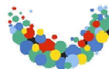
Universiade SHENZHEN 2011 12-23 août 2011