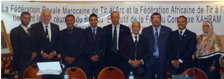
Réunion du Conseil de la FAA à Casablanca (MAR)

La FAA a dévoilé sa mission de soutenir et renforcer le développement d'un programme pour les athlètes, les juges et les entraîneurs, ainsi que des événements d'avenir en Afrique en collaboration avec toutes les parties intéressées. Les objectifs principaux ont été fixés; ils visent à donner au Coordinateur de Développement Continental pour l'Afrique les moyens de travailler avec les Associations Membres, afin de développer le tir à l'arc en Afrique et de faire augmenter le nombre de fédérations nationales actives, d'athlètes, d'entraîneurs et d'officiels au sein de la FAA, en suivant une feuille de route efficace menant jusqu'au niveau olympique.