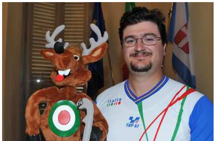
Le champion olympique 2004 Marco GALIAZZO et la mascotte M'arco