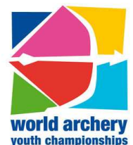
Championnats du Monde Jeunesse 22-28 August 2011