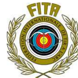
Congrès de la FITA 1-2 juillet 2011