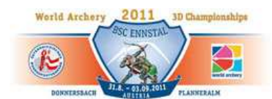
Championnats du Monde 3D 31 août-3 septembre 2011