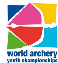
Mondiaux de la Jeunesse 22-28 août 2011