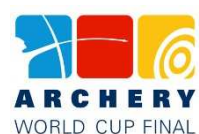
Finale de Coupe du Monde 24-25 septembre 2011