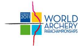
Mondiaux Handisport 10-17 juillet 2011