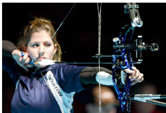
Joanna CHESSE, gagnante de la Finale de Coupe du Monde en Salle 2012 en arc à pouliches femmes

Une fantastique saison extérieure s'est achevée il y a deux mois avec la Finale de la Coupe du Monde. Et il est déjà temps de penser à la saison en salle. Le Tournoi Européen de Tir à l'Arc en Salle aura lieu du 18 au 20 janvier 2013 à Nîmes.