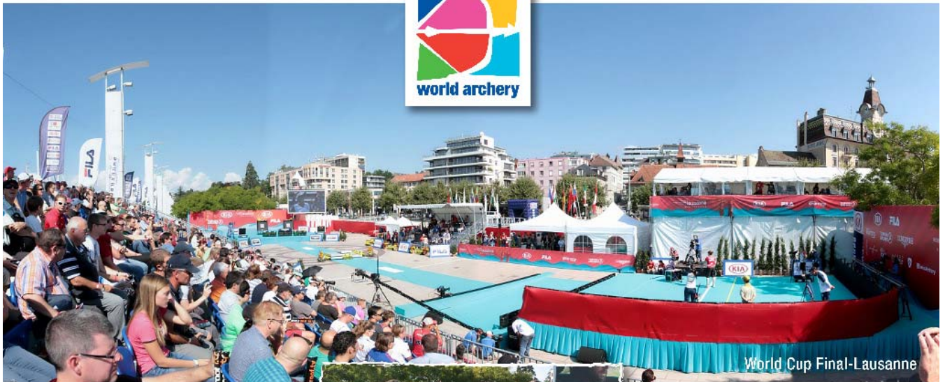
World Cup Final-Lausanne